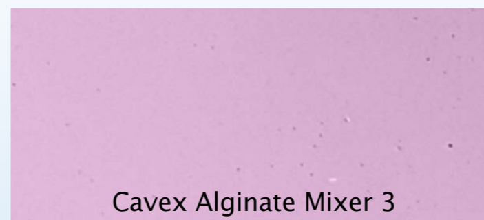
Cavex Alginate Mixer 3