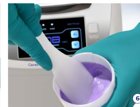
6. Haal de algiinaat mix in één beweging uit de mengbeker en breng het aan in de afdruklepel.