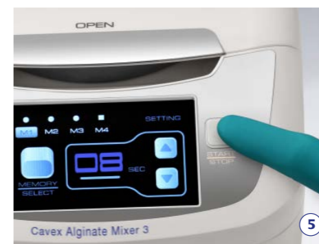
5. Kies het programma, druk op start en wacht tot het programma is afgerond.