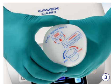
3. Sluit de mengbeker goed door het deksel, met de klok mee, dicht te draaien.