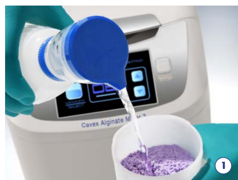
1. Doe de juiste dosering algiinaat en water in de mengbeker.