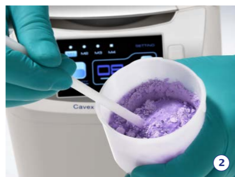
2. Roer kort voor om de mengbeker makkelijker te kunnen reinigen en ter behoud van de mixer.