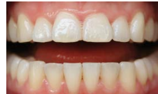
Después del tratamiento, una sonrisa blanca y brillante.